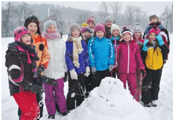
Spontaniczne ulepienie bałwana zawsze daje najwięcej frajdy

Podczas zimowiska OKSiR realizował program rozwijania zdrowego trybu życia poprzez sport, a także właściwego odżywiania.