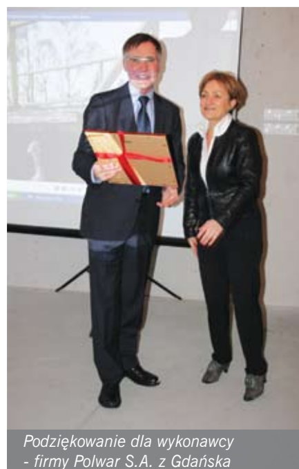
Podziękowanie dla wykonawcy - firmy Polwar S.A. z Gdańska