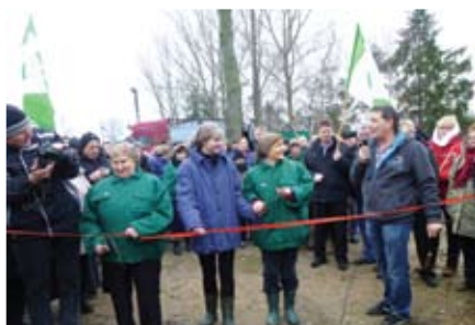
Wstęgę przecinano sierpami

Ubrana w kufajkę wójt prowadzi traktor w barwnej paradzie. O co chodzi? Traktorzystki rodem z czasów PRL-u otworzyły Skansen Żuławski Maszyn Rolniczych w Mokrym Dworze.