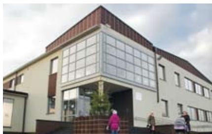
Rozbudowa szkoły o nowe skrzydło oraz widoczną na zdjęciu salę gimnastyczną pochłonęła blisko 7,5 mln zł