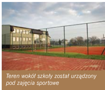
Teren wokół szkoły został urządony pod zajęcia sportowe

Nowa sala gimnastyczna z pewnością powiększy to zdolne grono o sportowców.