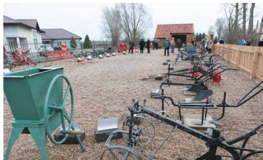
Skansen Żuławski Maszyn Rolniczych w Mokrym Dworze

Otwarcie zainicjowanego przez Stowarzyszenie Sottysów Gminy Pruszcz Gdański muzeum zabytkowych maszyn i narzędzi rolniczych przyciągnęło publiczność i media z całego Pomorza. A to za sprawą niecodziennej parady uroczych traktorzystek