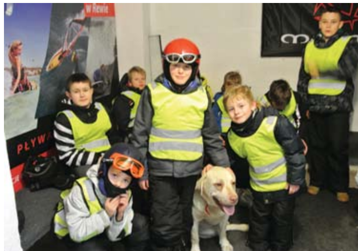
Bezpieczeństwo na stoku to podstawa