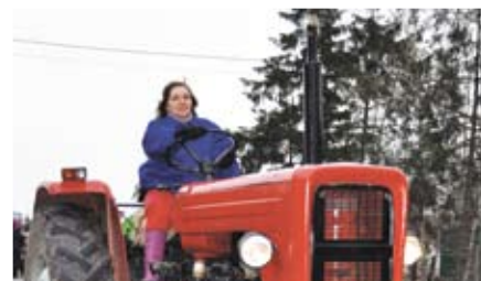
Kobiety na traktorach pokonały drogę z Wiśliny do Mokrego Dworu

rodem z PRL-u, w rolę których wcieliły się mieszkanki naszej gminy z wójtom na czele. Ubrane w pikowane kufajki, gumia-ki i gospodarskie chusty kobiety pokazały, że potrafią odnaleźć się w każdej sytuacji.