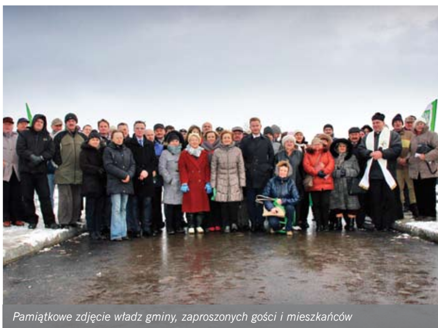
Pamiątkowe zdjęcie władz gminy, zaproszonych gości i mieszkańców