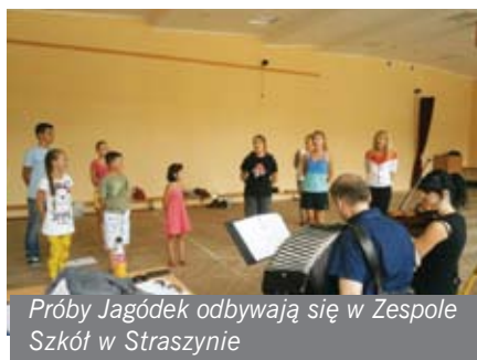
Próby Jagódek odbywają się w Zespole Szkół w Straszynie

Oficjalnie Zespół Pieśni i Tańca Jagódki istnieje od 2003 roku. Faktycznie, dzieci ze szkoły w Straszynie ludowe popisy dawały już kilka lat wcześniej.