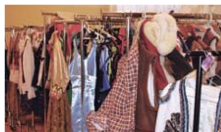
Tu też znajduje się garderoba

- Kiedy w 2003 roku pojawiła się inicjatywa utworzenia Zespołu Pieśni i Tańca