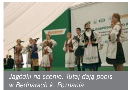
Jagódki na scenie. Tutaj dają popis w Bednarach k. Poznania