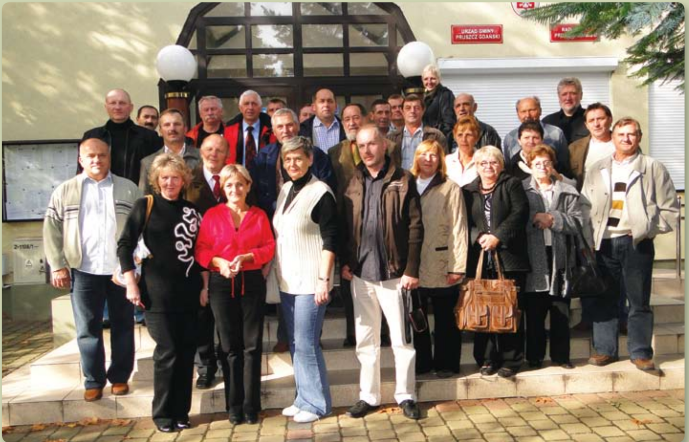
Sołtysi przed budynkiem Urzędu Gminy

Stowarzyszenie Sołtysów Gminy Pruszcz Gdański istnieje już od ponad roku. W lutym udało się sfinalizować wszelkie formalności związane z jego rejestracją.