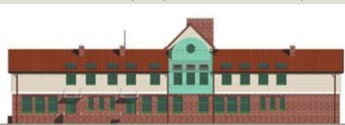
Projekt budowlany rozbudowy Szkoły Podstawowej w Wiślinie

W tym roku Gmina planuje pozyskać unijne fundusze na m.in. remont świetlicy w Lędowie, budowę szlaku kajakowego Motławy, wprowadzenie systemu ostrzegania mieszkańców o zagrożeniach (w tym powodziach), a nawet na uruchomienie lokalnej kolejki z Pruszcza do Straszyna.