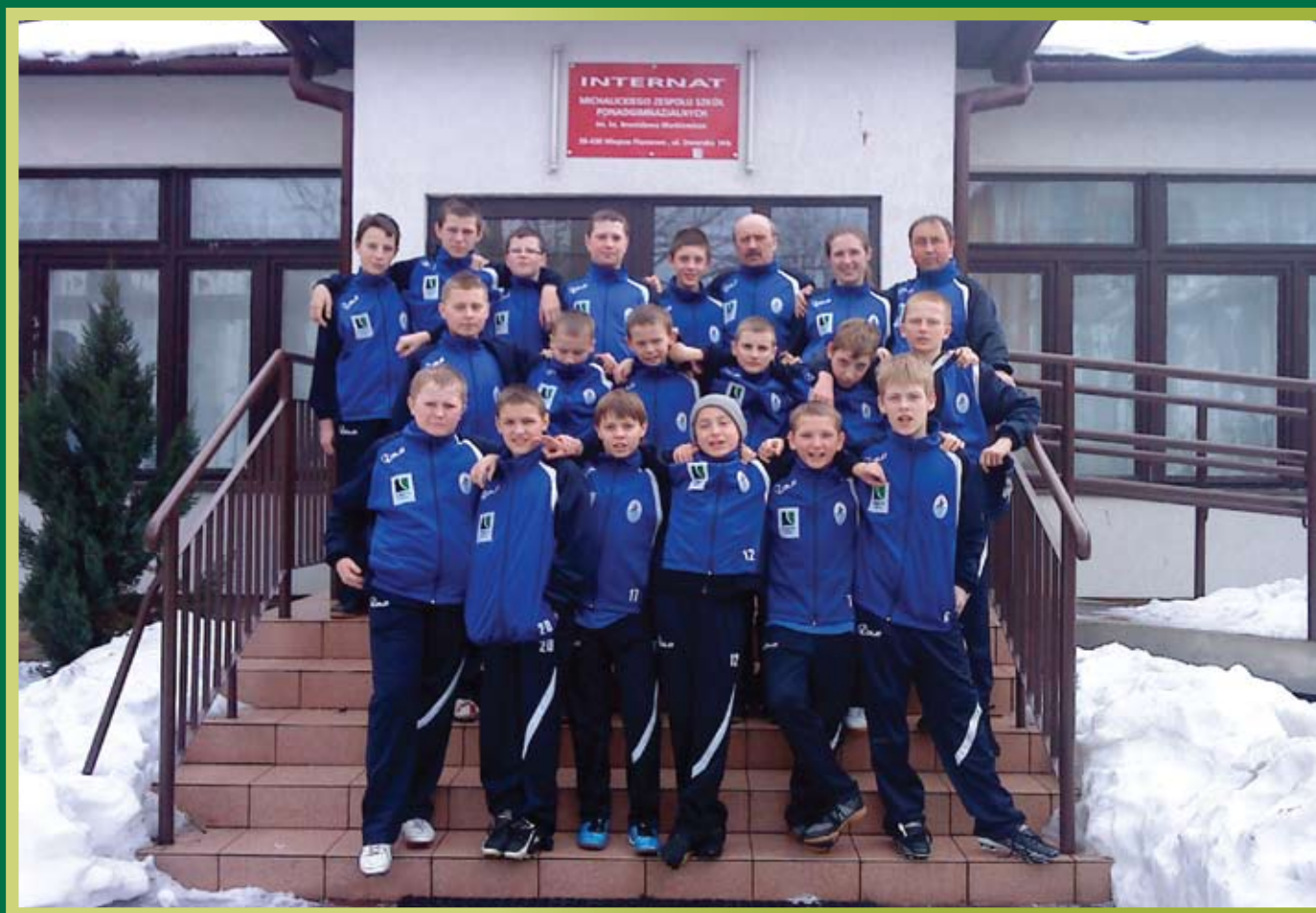
Młodzi podopieczni GTS podczas obozu szkoleniowego koło Krosna