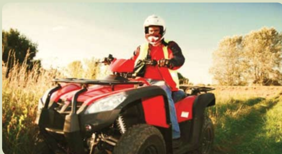
Quady pomogą w patrolowaniu wałów przeciwpowodziowych

Gmina Pruszcz Gdański zakończyła realizację partnerskiego projektu „Budowa zintegrowanego systemu powiadamiania i alarmowania ludności oraz zintegrowanej łączności na potrzeby systemu ratownictwa w gminach: Pruszcz Gdański, Cedry Wielkie, Suchy Dąb i Stegna”. Projekt o wartości 3 173 498,34 zł uzyskał dofinansowanie unijne z Regionalnego Programu Operacyjnego dla Województwa Pomorskiego w wysokości 50 proc. kosztów