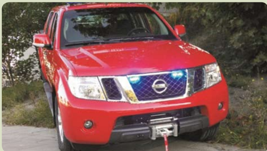
W ramach projektu zakupiono terenowy pojazd nagłaśniający

Sam system jednak nie zadziała jeśli nie będzie mu towarzyszył odpowiedni stan wiedzy na temat zachowań ludności w sytuacji kryzysowej. Poziom wiedzy społeczeństwa polskiego na ten temat jest bardzo niski. Wielokrotnie powtarzane przez służby ratownicze ostrzeżenia o nadchodzącym niebezpieczeństwie bardzo często nie skutkują, co doprowadza do jeszcze większych nieszczęść. O tym jaki dystans w tej dziedzinie dzieli nas od wysoko zorganizowanych społeczeństw można się było przekonać obserwując stopień zdyscyplinowania i wyszkolenia społeczeństwa japońskiego w obliczu niedawnej katastrofy w elektrowni atomowej. Tam jednakże szkolenia i edukacja zaczynają się już od najmłodszych lat. W tej dziedzinie w Polsce pozostaje jeszcze wiele do zrobienia. Gmina Pruszcz Gdański poczyniła już pierwsze kroki, a jej mieszkańcy mogą się czuć bezpieczniej.