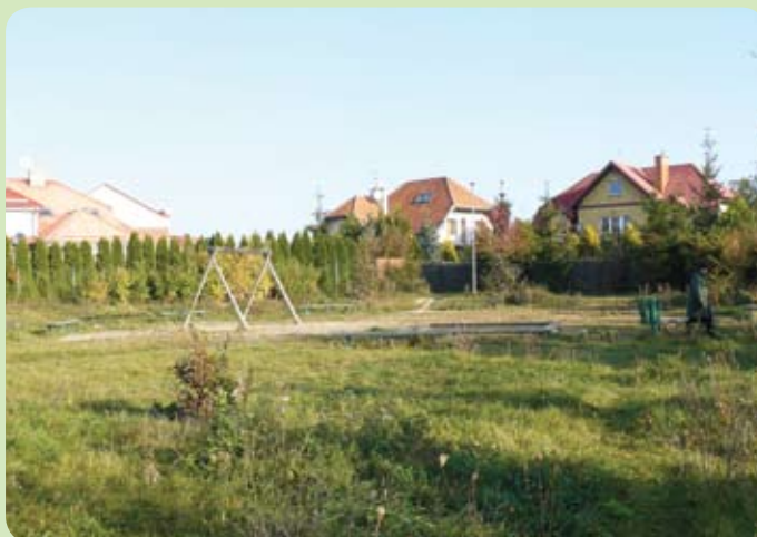
Nowy plac zabaw powstanie w miejscu istniejącego w rejonie ul. Lipowej, Jagodowej i Klonowej

i rekreacji w Rotmance w Gminie Pruszcz Gdański” jest Stowarzyszenie Społeczno-Kulturalne „Karol”, które realizuje go w partnerstwie z gminą Pruszcz Gdański. Przedsięwzięcie finansowo wspiera również Spółdzielnia Budowy Domów Jednorodzinnych Rotmanka. Wartość inwestycji to 329 299 zł, z czego 85 proc. to dofinansowanie unijne. Obiekt zlokalizowany będzie w bezpośrednim sąsiedztwie Zespołu Szkół w Rotmance, na działce należącej do gminy Pruszcz Gdański przy ul. Lipowej, Jagodowej i Klonowej. W ramach projektu zostanie wykonany: plac zabaw dla młodszych dzieci, w tym: zestaw zabawowy, huśtawka, karuzela, urządzenia integracyjne dla dzieci niepełnosprawnych - bujaczek i huśtawka, 2 ławki, kosz, tablice z regulaminem i ogrodzenie, siłownia do ćwiczeń dla dorosłych, skatepark dla młodzieży, miniamfiteatr z drewnianymi trybunami.