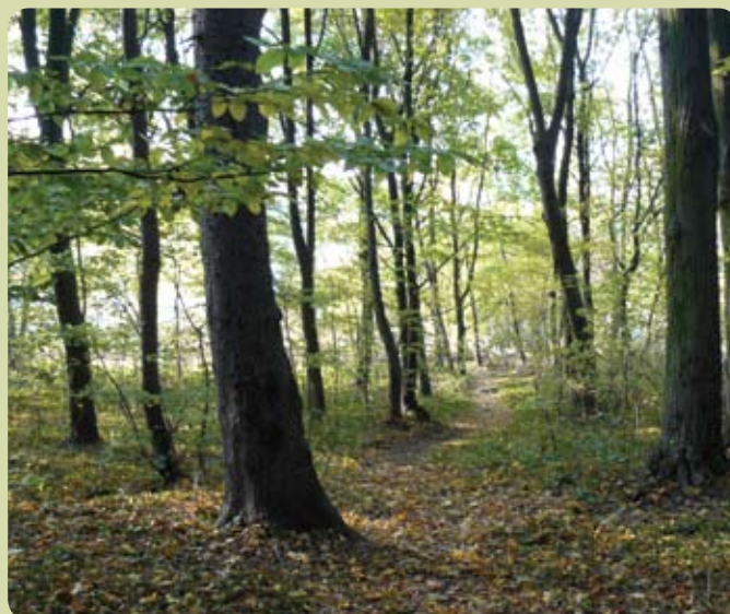
Park w Rotmance

Na terenie leśnym znajdują się buki, dęby, lipy i sosny, które liczą ponad 100 lat.