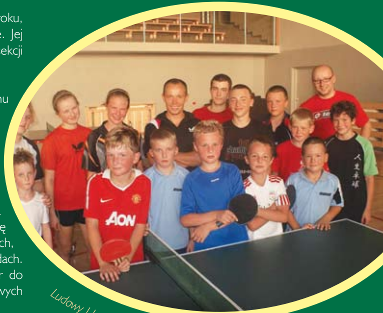
Ludowy Uczniowski Klub Tenisa Stołowego w Straszynie

W grudniu czekają nas najważniejsze turnieje ogólnopolskie w Zielonej Górze i Radzynie Podlaskim, które są eliminacjami do Mistrzostw Polski.