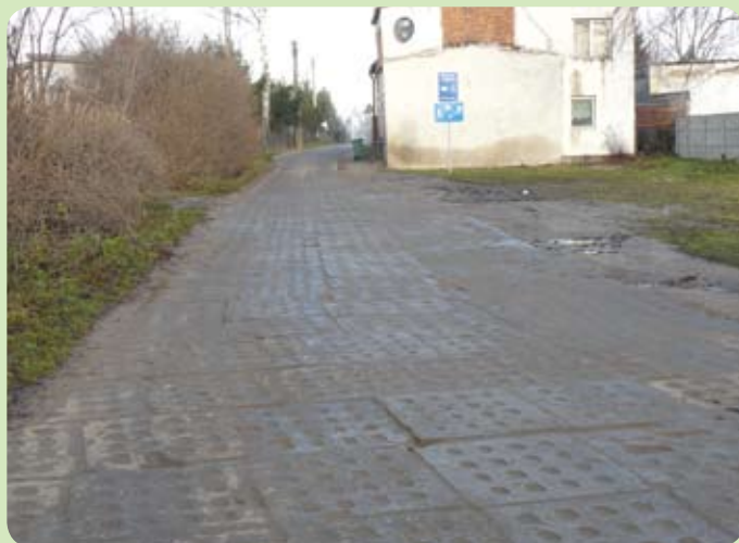
Ulica Lotnicza w Cieplewie będzie budowana etapami

W ramach inwestycji zostaną wykonane nowa nawierzchnia asfaltowa na ul. Lotniczej, chodniki, miejsca postojowe, zaś ul. Porzeczkowa i Jagodowa po modernizacji będzie funkcjonować jako ciąg pieszo-jezdny. To duża inwestycja, dlatego będzie realizowana etapami. Zakończenie przebudowy jest przewidziane na lipiec 2013 r. Koszt inwestycji to 2 683 220 zł.