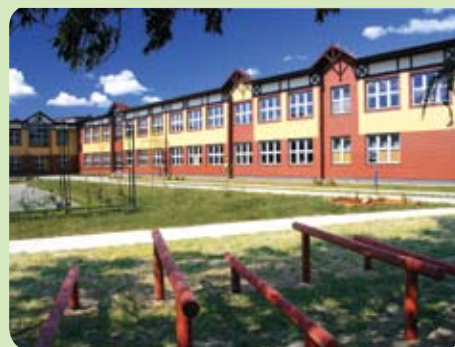
Uczniowie klas I-III wszystkich szkół podstawowych z terenu gminy Pruszcz Gdański zostaną objęci programem

br., a zakończą 28 czerwca 2012 r. Projektem zostanie objętych w sumie 348 uczniów. Nauczyciele sami ustalali z jakich zajęć będą korzystać ich podopieczni. Są to m.in. zajęcia teatralne, z pisania i czytania, przyrodnicze, rytmiczno-muzyczne, matematyczne, itp. Projekt jest innowacyjny, ponieważ swoją ofertą obejmuje także dzieci uzdolnione.