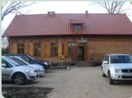
Obiekt nabrał nowego blasku