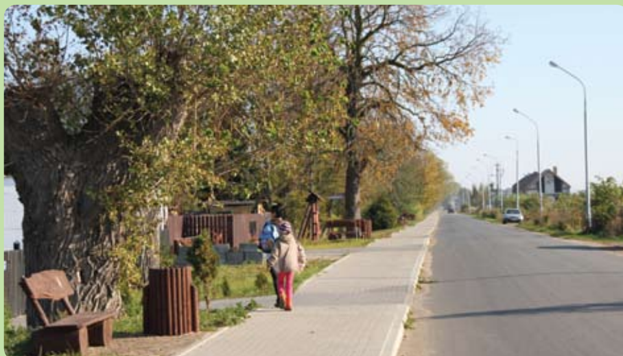
Ścieżka rekreacyjno - edukacyjna w Radunicy

W tej chwili zatarł się już podział na samorządowców doświadczonych i tych, co są pierwszy raz w radzie. Wszyscy rozumieją i dostrzegają problemy w całej gminie. Jest to potrzebne zwłaszcza teraz, gdy dopinamy budżet na 2012 rok. Chcemy, tak rozłożyć środki, by rozwój wszystkich miejscowości był zrównoważony.