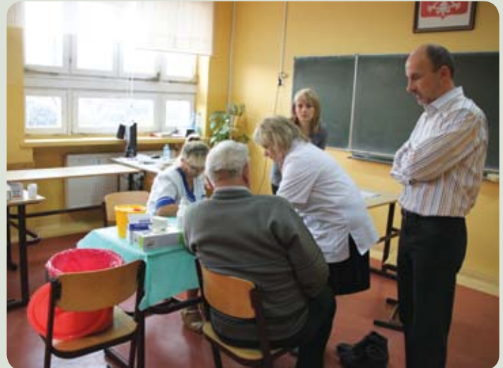
Mieszkańcy uczestniczyli w bezpłatnych badaniach w Zespole Szkół w Łęgowie