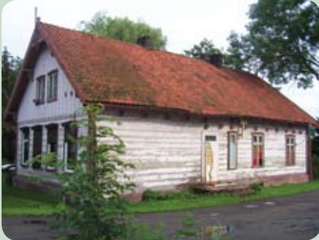
Świetlica przed remontem