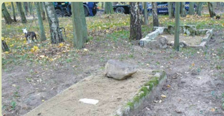
Udało się wyciąć krzaki i odkryć groby