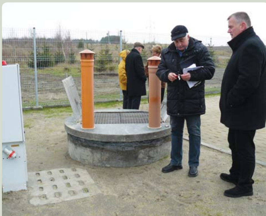
Nowa przepompownia ścieków w Jagatowie

Gmina Pruszcz Gdański w trosce o ochronę ziemi, wód podziemnych i powierzchniowych przed zanieczyszczeniem ściekami komunalno-bytowymi, intensywnie rozbudowuje układ kanalizacji