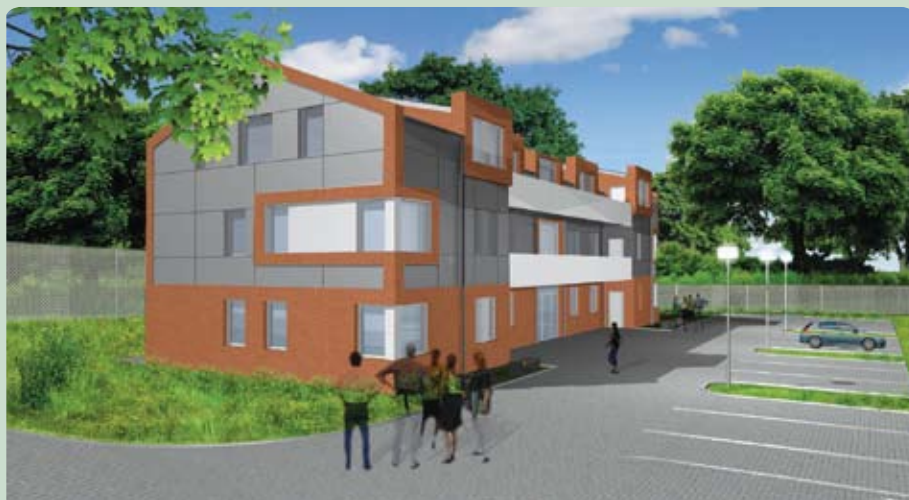
Projekt nowego budynku z mieszkaniami komunalnymi

W tym roku rozpocznie się budowa budynku z 14 mieszkaniami komunalnymi na działce gminnej w Straszynie przy ul. Spacerowej. Gmina uzyskała już wszelkie pozwolenia na realizację tej inwestycji i w ciągu trzech miesięcy ogłosi przetarg, w którym wyłoni wykonawcę