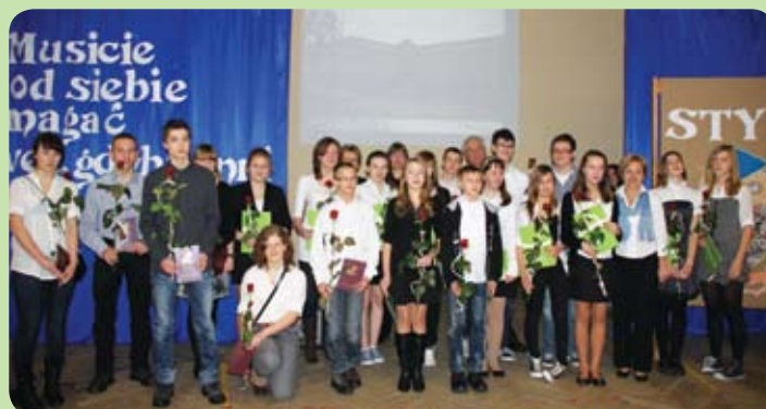
... 27 ze szkół podstawowych i 25 z gimnazjów