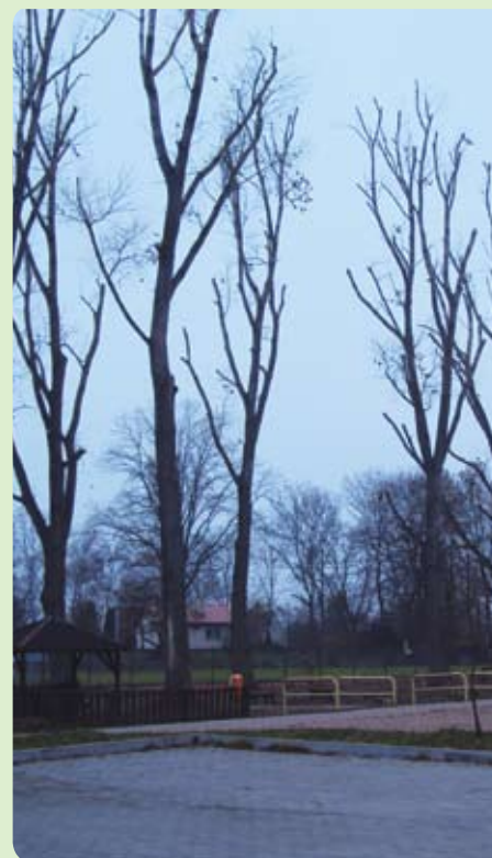
Topole kanadyjskie po wykonanej redukcji korony w Wiślinie

Poszczególne gatunki drzew charakteryzują się zróżnicowanymi możliwościami regeneracyjnymi po redukcji korony. Lepiej regenerują: lipy, klony jesionolistne, dęby, topole, wierzby, jesiony, cisy. Gorzej regenerują: kasztanowce, robinie, iglicznie, wiązy, klony (z wyjątkiem jesionolistnych), buki, brzozy, orzechy, skrzydłorzecz, orzeszniki. Bardzo słabo regenerują wszystkie drzewa iglaste (z wyjątkiem modrzewi, żywotników i cisów)