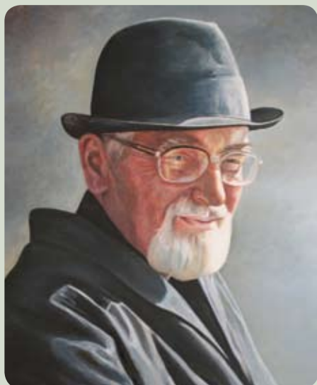
Portret mężczyzny autorstwa Danuty Kraszewskiej, olej

Danuta Kraszewska, prezes Zarządu Stowarzyszenia Twórców Przystanek Sztuka