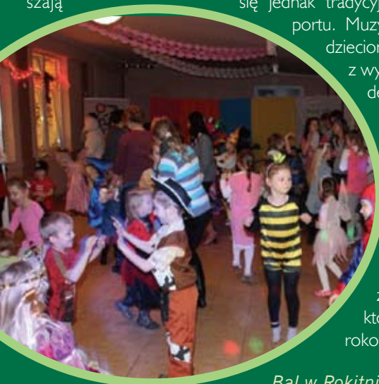
Bal w Rokitnicy

konkurs związany jest z kolorem wyspy, na której aktualnie znajdują się dzieci. Każde zadanie stanowi nie lada wyzwanie. Właściwie wykonane polecenie animatorów pozwala na „zdobycie” konkretnego koloru i zabarwienie świata na nowo! Do tej pory w tej ekscytującej podróży uczestniczyły m.in. dzieci z Lędowa, Bogatki, Wiśliny, Goszyna, Straszyna, Żuławy, Radunicy, Rokitnicy, Żukczyna i Rekcina. Na ostatni w tym sezonie karnawałowy bal kostiumowy Kolorowa Przygoda OKSiR zaprasza dzieci w wieku 4-12 lat w sobotę, 18 lutego. Impreza taneczna połączona z konkursami, prowadzona przez Ciotkę Agatę i Balbinę, odbędzie się w sali kolumnowej OKSiR w Ciepłowie przy ul. Długiej 20A. Wstęp wolny. Początek o godz. 14.