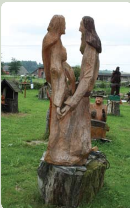
Rzeźba w drewnie autorstwa Zenona Kosatera