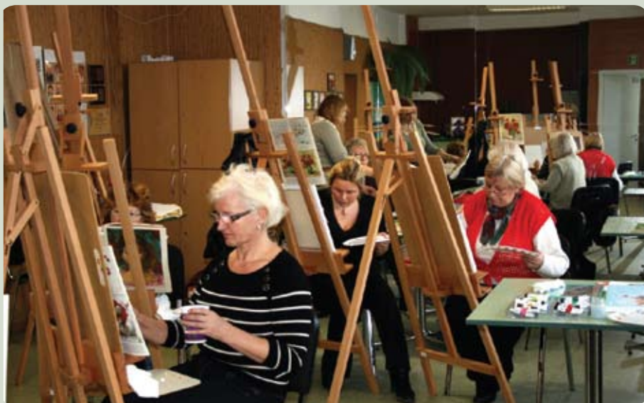
Stowarzyszenie zrealizowało cykl warsztatów pn. „Stajnia Pegaza”