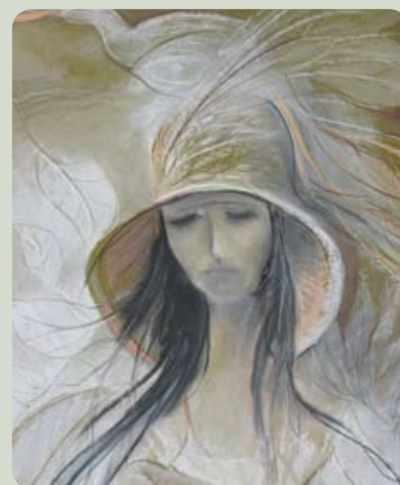
Portret kobiety autorstwa Teresy Piotrowskiej, pastel