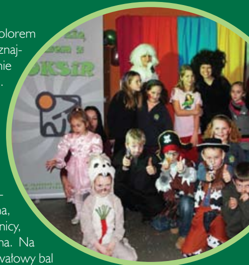
Bal w Żuławie