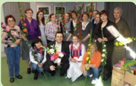
Uczestniczki kursu „Kurpiowskie palmy”

U progu wiosny kilkanaście mieszanek gminy Pruszcz Gdański uczestniczyło w zorganizowanym przez OKSiR kursie „Kurpiowskie palmy”