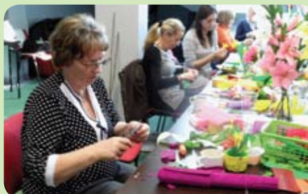
Panie przez pięć dni tworzyły wielobarwne kwiaty i wielkanocne palmy z kolorowej krepiny

- Liczba miejsc na kursie była ograniczona,