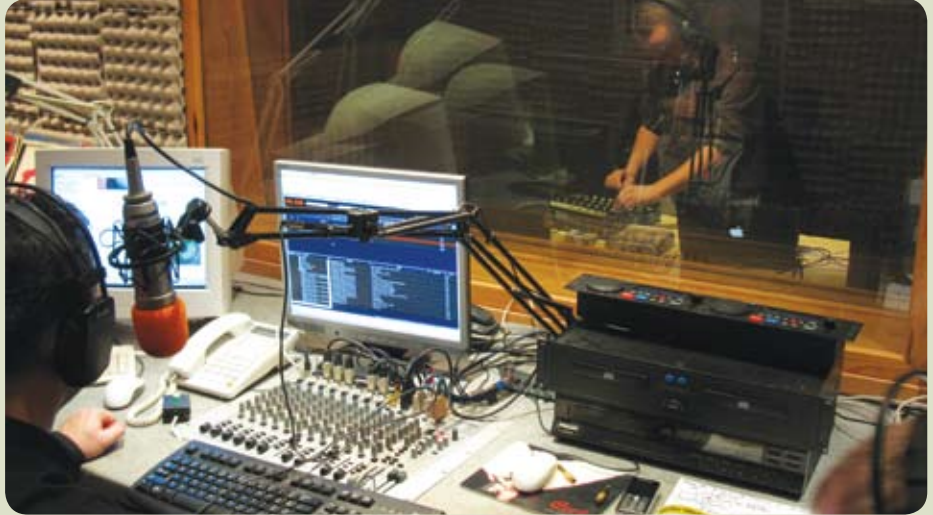
Radio internetowe „Toksyna FM” nadaje sygnał od 6 września 2001 r.

W 2007 r. częścią medialną „Doliny Raduni” oprócz gazety stało się radio internetowe „Toksyna FM”, mieszczące się w Straszynie przy ul. Spacerowej 13. Radio nadaje swój sygnał nieprzerwanie od 6 września 2001 r. i jest jedną z najstarszych internetowych stacji radiowych nie tylko w regionie,