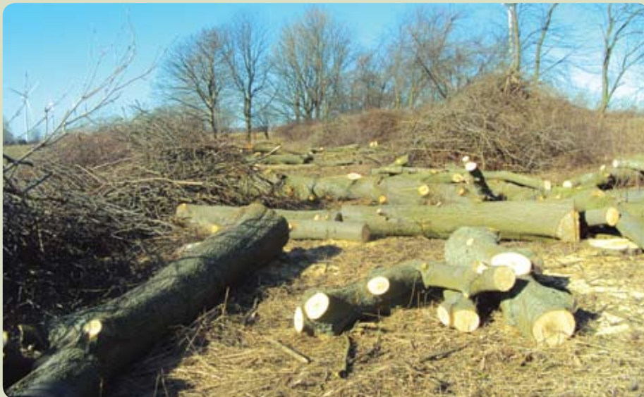
W Bystrej doszło do nielegalnej wycinki drzew

W Urzędzie Gminy w Pruszczu Gdańskim odbyło się spotkanie, w którym udział wzięli przedstawiciele gmin Pruszcz Gdański, Suchego Dębu, starostwa powiatowego, sołtysi oraz Pomorskiego Ośrodka Doradztwa Rolniczego, Regionalnej Dyrekcji Ochrony Środowiska w Gdańsku, Agencji Nieruchomości Rolnych oddział Terenowy w Gdańsku z siedzibą w Pruszczu Gdańskim.