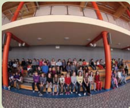
Podpisanie porozumienia odbyło się w Zespole Szkół w Rotmance

W Zespole Szkół w Rotmance odbyło się uroczyste podpisanie porozumienia pomiędzy dyrektorem Ośrodka Kultury, Sportu i Rekreacji Gminy Pruszcz Gdański, a dyrektorami szkół podstawowych i gimnazjalnych gminy Pruszcz Gdański w sprawie realizacji „Programu Usportowienia Dzieci i Młodzieży Gminy Pruszcz Gdański” pod patronatem wójta gminy Pruszcz Gdański.