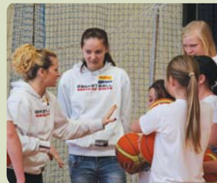
Nie zabrakło także pokazów sportowych

Rejon Zespołu Szkół w Straszynie – tenis stołowy, piłka nożna, kajakarstwo rekreacyjne. Grupy liczą od 15 – 30 osób. W pierwszej fazie zajęcia odbywają się 2 razy w tygodniu plus raz w tygodniu kadra gminna w tenisie stołowym i siatkówce.