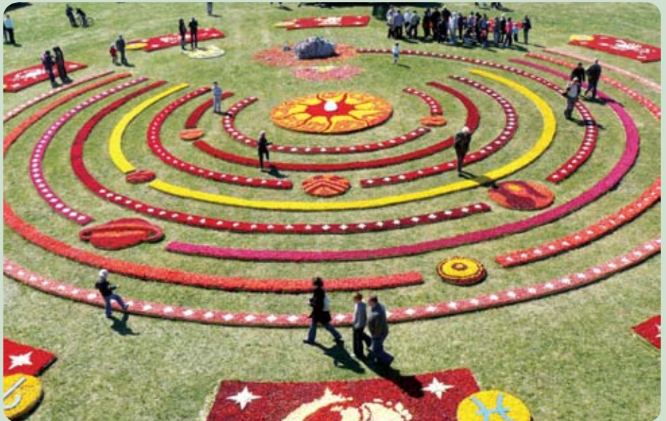
Żuławski Tulipan to wyjątkowe wydarzenie na mapie Pomorza