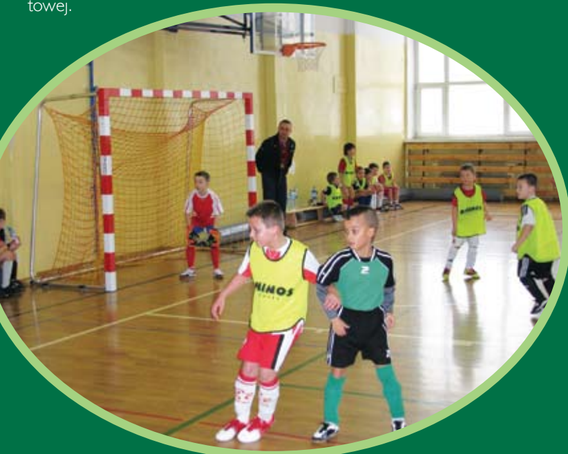
Piłkarze wygrali dwa pierwsze mecze

Wszystkich chętnych nowych piłkarzy z rocznika 2003 i młodszych zapraszamy na treningi które odbywają się w każdy poniedziałek w godz. 15:30 - 17:00, piątek w godz. 17:00 - 18:30 w Zespole Szkół w Straszynie przy ulicy Starogardzkiej 48 w hali sportowej.