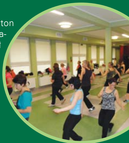
Frekwencja podczas maratonu dopisała

Hasłem przewodnim maratonu było „Na przekór zimie i własnym słabościom” i z tym nastawieniem, po krótkiej weryfikacji uczestniczek, rozpoczęła się wspólna zabawa. Na pierwszy ogień poszło gorące latino dance, które pozwoliło wydobyć z pań siłę, energię i ekspresję. Gorące rytmy tańca rozgrzały i przygotowały uczestniczki do drugiej godziny ćwiczeń, tym razem na stepach. Sama nauka oraz opanowanie układu choreograficznego na platformach do muzyki lat 70-tych, dostarczyły wszystkim ogromnej satysfakcji. Po części taneczno-choreograficznej nadszedł czas na etap wzmacniająco-wyszczuplający. Instruktorka zaproponowała różne warianty ćwiczeń na mięśnie brzucha, bioder i pośladków. Końcówkę maratonu stanowił kilkuminutowy stretching - obowiązkowy po każdym wysiłku fizycznym. Na pożegnanie każda z pań otrzymała drobne upominki w postaci kosmetyków.