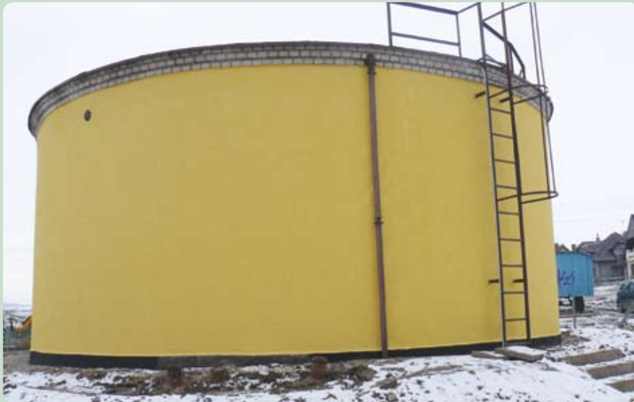
Nowy zbiornik stacji uzdatniania wody w Łęgowie

Mobilna estrada - Urząd Gminy w Pruszczu Gdańskim ogłosił przetarg na dostarczenie mobilnej estrady. Dofinansowanie na ten cel udało się pozyskać w ramach Programu Rozwoju Obszarów Wiejskich na lata 2007-2013. Scena musi spełniać następujące parametry - jej wymiary po rozłożeniu to 10 m na 6 m na 6 m. Podłoga ma być antypoślizgowa, wodoodporna; pokrycie dachu z czarnej plandeki, a ściany boczne prócz plandeki, muszą być pokryte siatką przepuszczającą powietrze. Wymagane są także barierki ochronne po bokach i z tyłu sceny oraz schody z poręczami po obu stronach.