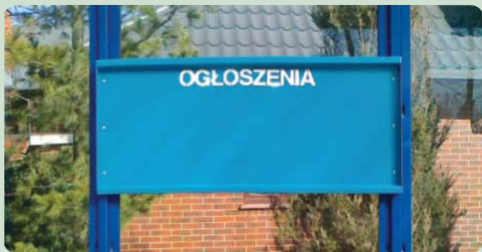
Na tablicach można bezpłatnie wieszać ogłoszenia

Na 30 przystankach autobusowych na terenie Gminy Pruszcz Gdański pojawią się tablice, na których będzie można bezpłatnie wieszać różne ogłoszenia (ulotki, drobne reklamy, ogłoszenia itp.). Pierwsze z nich pojawiły się już w Rotmance.