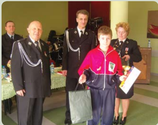
Organizatorem turnieju był Zarząd Oddziału Gminnego Związku OSP PR

W Cieplesie odbył się XXXV Ogólnopolski Turniej Wiedzy Pożarniczej na szczeblu gminnym pn. Młodzież Zapobiega Pożarom