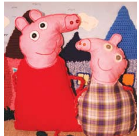
Poduchy z Borkowa

- Aktywnie działa nas do 10 osób – mówią. – Wszystkie pracujemy lub opiekujemy się wnukami, więc nie mamy zbyt wiele wolnego czasu. Jednak czwartkowe wieczory są dla nas. Spotykamy się w świetlicy, robimy kawkę i zabieramy za nasze rękodzieło.