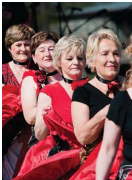
Tancerki z Rokitnicy