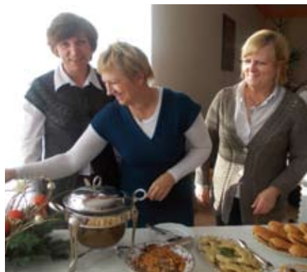
Smakotyki z Roszkowa

Pierogi to praktycznie znak rozpoznawczy KGW Roszkowo. Można w nich zasmakować zawsze podczas stałych imprez gminy, jak dożynki czy Żuławski Tulipan. Ale nie tylko pierogi gospodyń z Roszkowa podbijają podniebienia mieszkańców. Podczas ostatnich dożynek w Będzie-