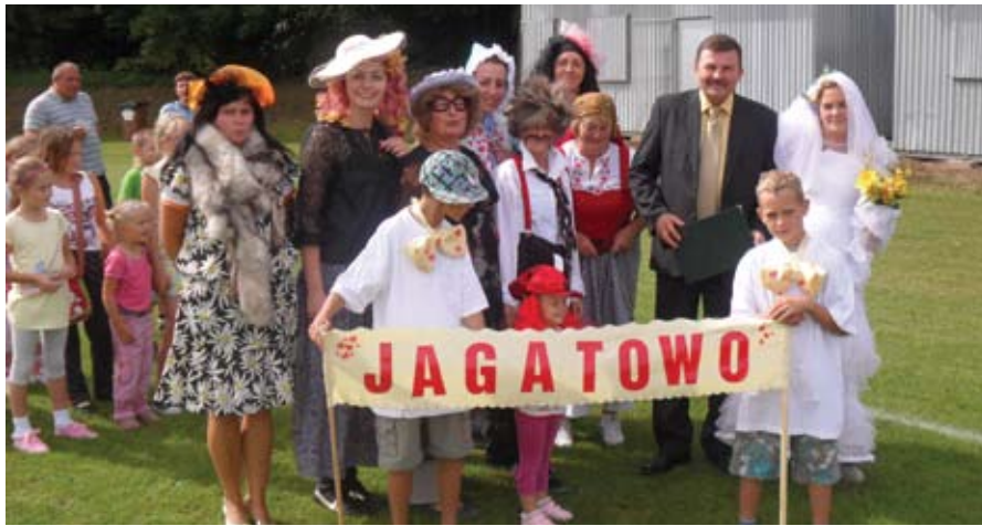
Przebierańce z Jagatowa

szynie wypiek tutejszego Koła zdobył I miejsce w konkursie na najlepszy sernik.