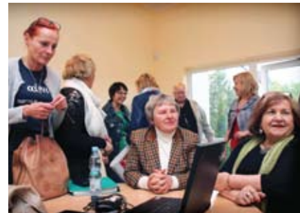
Widać, że dobrze się czują w swoim towarzystwie