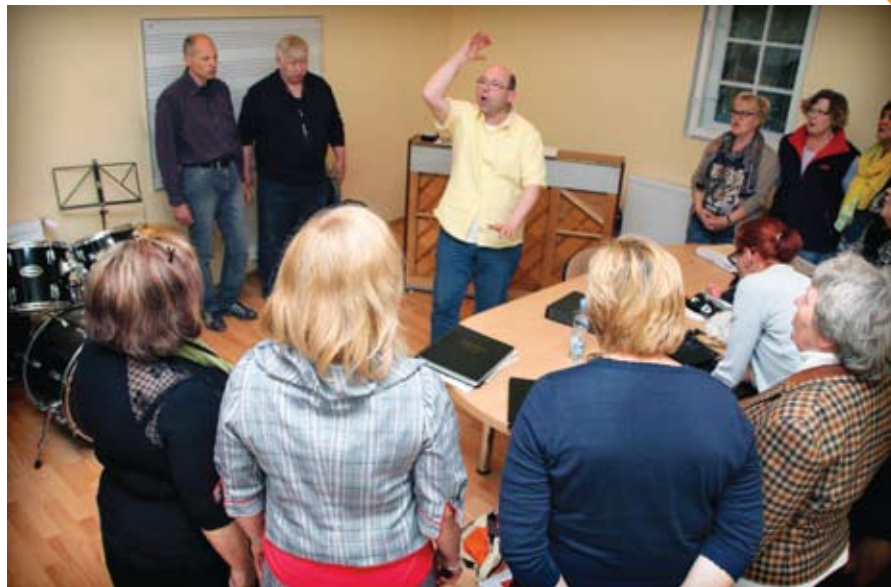
Próby chóru odbywają się co poniedziałek w jednej z sal przedszkola Wesola Nutka w Rotmance

- Zapraszamy do nas! Śpiewać każdy może! – zachęcają.