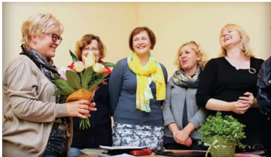
Chórzyści tworzą jedną wielką rodzinę. Pamiętają też o swoich urodzinach

Soprany i alty to żony, mamy, a czasami też babcie; śpiewa pielęgniarka, katecheta, pani strażak na emeryturze i dyrektorka przedszkola. Wśród tenorów i basów mamy informatyka, elektryka, spedytora i... żartownisia, który pytany o zawód odpowiada: „zawód miłosny”. Razem tworzą nie tylko wyjątkowy chór, ale też zgraną paczkę ludzi, którym bardzo dobrze w swoim towarzystwie.