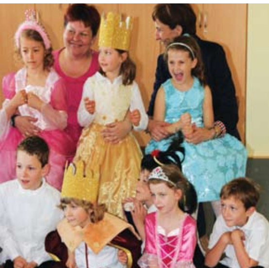
Borkowo. W Zespole Szkolno – Przedszkolnym odbył się V Gminny Konkurs Małych Form Artystycznych. Jurorzy nie mieli łatwego zadania, o czym świadczy fakt przyznania dwóch pierwszych miejsc: Niepublicznemu Przedszkolu „Wesoła Nutka” z Rotmanki za przedstawienie pt. „Królewna Śmieszka” oraz Publicznemu Przedszkolu w Borkowie za „Księżniczkę na ziarnku grochu”.

Festiwale, przeglądy, festyny – w gminie Pruszcz Gdański zawsze coś się dzieje!