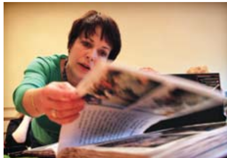
Dużo razem podróżują – jako chór i grupa przyjaciół. Najważniejsze wydarzenia odnotowują w kronice