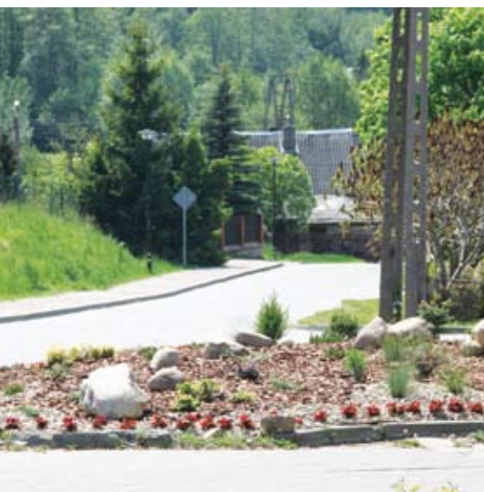
Straszyn. Urządzony w ramach konkursu skwerek przy cmentarzu nawiązuje stylistyką do gór – rodzinnych stron Ojca Świętego (plac mieści się przy ul. Jana Pawła II). Zdecydowano się na nasadzenia i głązy.

- Zarezerwowaliśmy na ten cel więcej środków niż otrzymaliśmy zgłoszeń. Wierzę jednak, że za rok tendencja będzie dokładnie odwrotna – dodaje wójt. Sołectwa, które przystąpiły do konkursu otrzymały po 5 tys. zł na ukwiecenie wybranych przez siebie terenów.