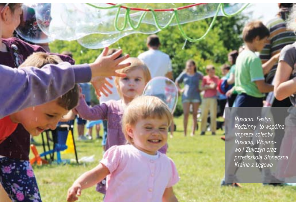
Rusocin. Festyn Rodzinny to wspólna impreza sołectw Rusocin, Wojanowo i Żukczyn oraz przedszkola Słoneczna Kraina z Łęgowa