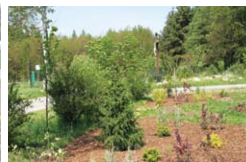
Żuławka. W znacznej części zagospodarowano już teren przy wiejskiej świetlicy. Pojawią się tu jeszcze kwiaty i mała architektura.