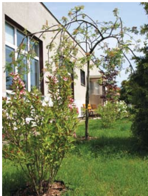
Cieplewo. W ramach projektu ukwiecono dwa miejsca: teren przy świetlicy i pas pobocza przy skrzyżowaniu ulicy Długiej z Lotniczą. Zdecydowano się na pięciorniki, bukszpan i buk pospolity.