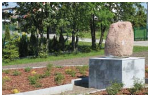
Arciszewo. Poprzez posadzenie róż, pięciorników i jałowców zagospodarowano teren przy placu zabaw. Centrum skweru stanowi kończony właśnie pomnik poświęcony pamięci admirała Krzysztofa Arciszewskiego.