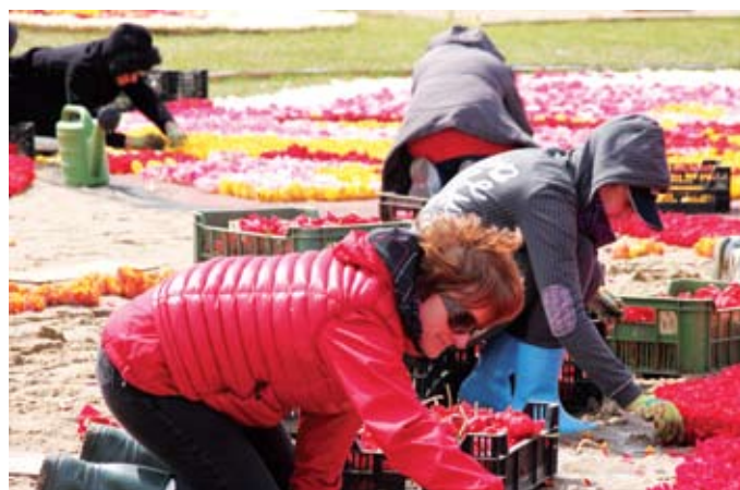
Tulipanowy dywan powstawał trzy dni – mieszkańcy gminy Pruszcz Gdański układali go na kolanach, w chłodnej i wietrznej aurze