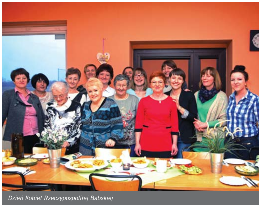
Dzień Kobiet Rzeczypospolitej Babskiej

Niedawno członkinie Rzeczpospolitej Babskiej zorganizowały spotkanie dla wszystkich kobiet Wiślinki z zakresu profilaktyki raka piersi i szyjki macicy. Prelekcję ze specjalistami poprzedziło przygotowanie poczęstunku. W związ-