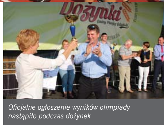
Oficjalne ogłoszenie wyników olimpiady nastąpiło podczas dożynek

I. Przejazdowo, II. Wiślinka, III. Borkowo, IV. Ciepłowo, V. Straszyn, VI. Łęgowo.