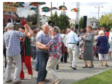
Nasi seniorzy potrafią się bawić jak mało kto! Energii do tańca im nie brakuje