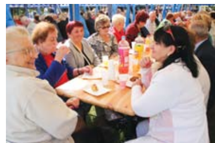
Doroczny Dzień Seniora cieszy się bardzo dużym zainteresowaniem. To świetna okazja do spotkań nie tylko z sąsiadami