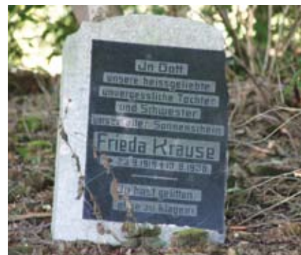
Zachowały się fragmenty przedwojennych nagrobków

Bogatka otrzymała przywilej lokacyjny w 1346 r. i, jak wskazują źródła historyczne, była wsią liczącą się na mapie Żuław. W XIV w. funkcjonowała tu duża cegielnia, zaopatrująca w budulec m.in. Gdańsk. Z tego też wieku pochodził kościół. Po okresie zniszczeń spowodowanych wylewami Wisły Bogatka ponownie otrzymała lokację w 1547 r. Tego roku osadzili się tu pierwsi mennonici. Była wsią wolną, z własną parafią.