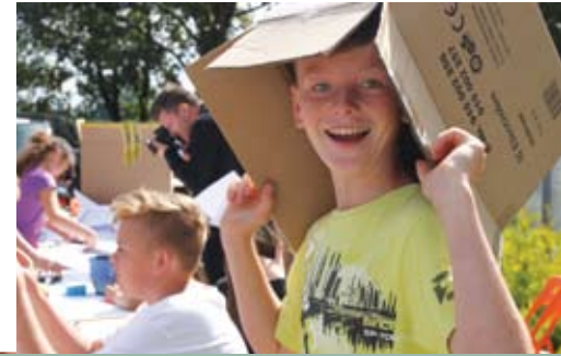
WAKACJE W STANICY