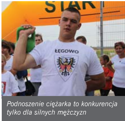
Podnoszenie ciężarka to konkurencja tylko dla silnych mężczyzn