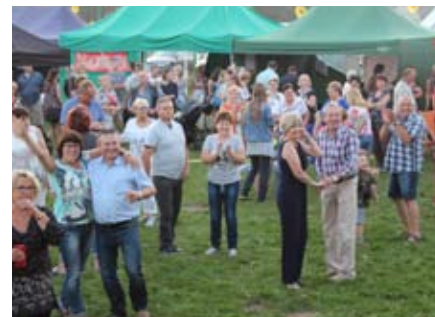
Mieszkańcy i przyjaciele Wiślinki bawili się do późnego wieczora