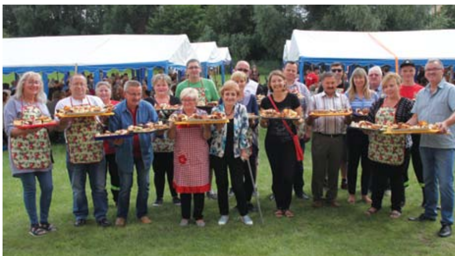
Pamiątkowe zdjęcie „kelnerów” to już tradycja. Seniorom w dniu ich święta usługiwali sołtysi, radni i strażacy z Jagatowa