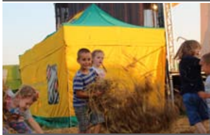
Na dzieci, poza programem artystycznym czekały dmuchane zamki, kule wodne, kolejka i kuczki. Jednak najlepszą zabawą okazała się spontaniczna bitwa na słomę!