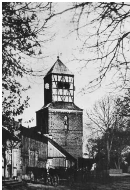
Kościół w Bogatce na przedwojennej fotografii